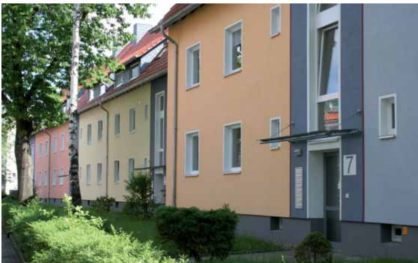
... und Allensteiner Straße 1 – 7