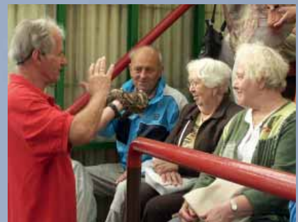
Impressionen unserer letzten Mieterfahrt mit den Stationen Goslar, Okersee – und einer Prise Abenteuer auf der Schlangenfarm