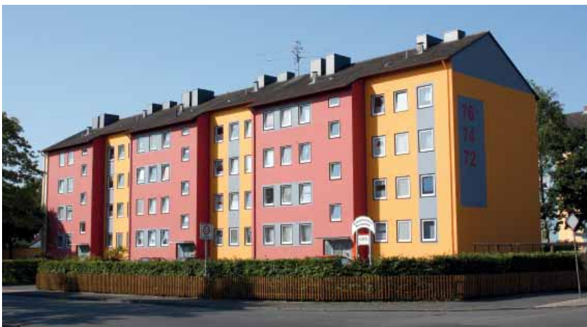
Auch optisch ein Gewinn: Unsere Modernisierungen aus 2009: Alter Postweg 72 – 76 ...

Eine weitere umfangreiche Sanierung planen wir in der Borsigstraße/Daimlerstraße. Hier steht die weitreichende Modernisierung der Wärmeversorgung einschließlich der Warmwasserbereitung im Fokus. Die zentrale Wärmeerzeugungsanlage in der Borsigstraße 44 sowie das gesamte Fernleitungsnetz werden stillgelegt und durch dezentrale Solarenergiezentralen in den einzelnen Wohnblöcken ersetzt. Die solare Anlagentechnik wird sowohl für die Warmwasserbereitung als auch zur Heizungsunterstützung genutzt. Hierdurch kann der Jahresheizenergiebedarf für die Mieter deutlich gesenkt werden. Im Zuge dieser Modernisierung werden auch die obersten Geschosdecken gemäß der Energieeinsparverord-