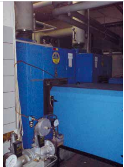
Ein echtes Kaliber - die neue Heizungsanlage in der Borsigstraße

Drei große Maßnahmen prägen das kommende Geschäftsjahr. Dabei zielt das umfangreichste Projekt auf die energetische Sanierung der Wohnanlage Allensteiner Straße 8 – 12. Allein hier werden die Modernisierungsmaßnahmen ein Gesamtvolumen von ca. 1.070.000 Euro erreichen. Neben der Erneuerung des Daches und der Fenster wird das gesamte Gebäude nach den Richtlinien eines Niedrigenergiehauses wärmedämmend. Zusätzlich werden